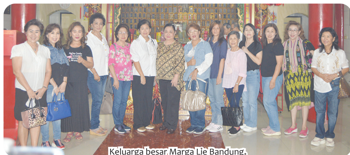
Keluarga besar, Marga Lie Bandung.