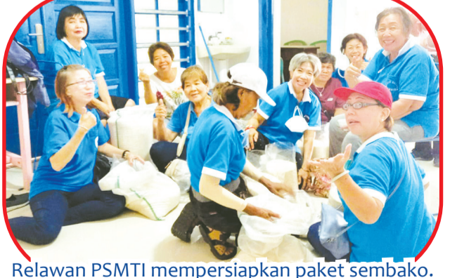
Relawan PSMTI mempersiapkan paket sembako.

CIREBON (IM) - Pengurus PSMTI (Paguyuban Sosial Marga Tionghoa Indonesia) Cabang Cirebon Jawa Barat setiap tahun selama bulan suci Ramadhan menyelenggarakan berbagai kegiatan sosial dan amal.