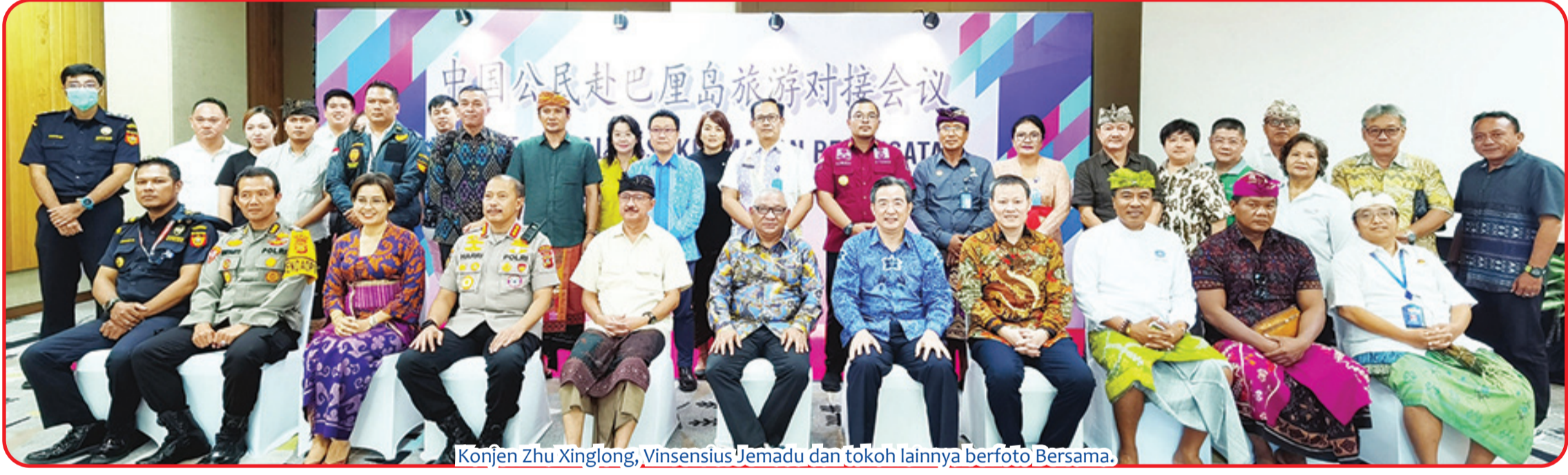
Konjen Zhu Xinglong, Vinsensius Jemadu dan tokoh lainnya berfoto Bersama.

Pemerintah Indonesia akan lebih memperhatikan keamanan pariwisata dan bersedia memperkuat hubungan komunikasi dengan Tiongkok. Hal ini untuk menciptakan iklim wisata yang aman dan nyaman bagi para wisatawan. • idn/din