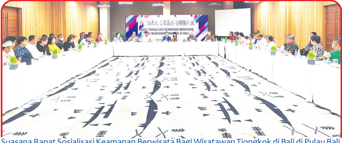
Suasana Rapat Sosialisasi Keamanan Berwisata Bagi Wisatawan Tiongkok di Bali di Pulau Bali.

DENPASAR (IM) - Konjen Tiongkok di Denpasar, Kamis (27/4) lalu menyelenggarakan Rapat Sosialisasi Keamanan Berwisata Bagi Wisatawan Tiongkok di Bali.