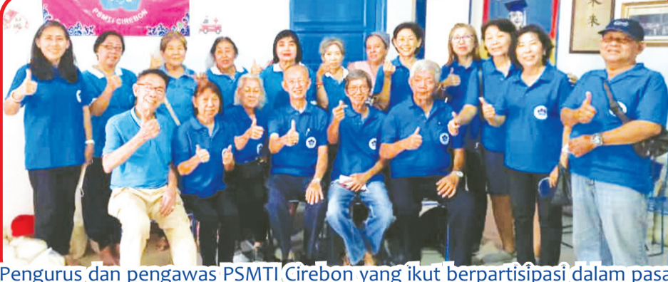
Pengurus dan pengawas PSMTI Cirebon yang ikut berpartisipasi dalam pasar murah.

Ini adalah kegiatan pasar murah perdana yang diadakan tahun ini.