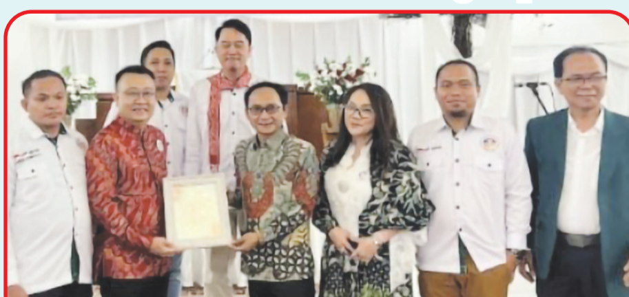
Suasana Paskah DPP Berani dengan tajuk 'Refleksi Paskah untuk Kebangkitan Bangsa'.

Menurut Ardy, harganya terlalu mahal jika hanya demi kepentingan politik semata, meng-